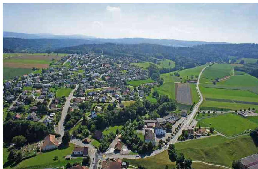
Mit der Ortsplanungsrevision werden wichtige Weichen für die Zukunft gestellt.